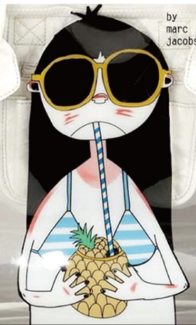
by marc jacobs