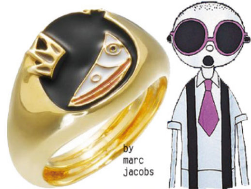
by marc jacobs