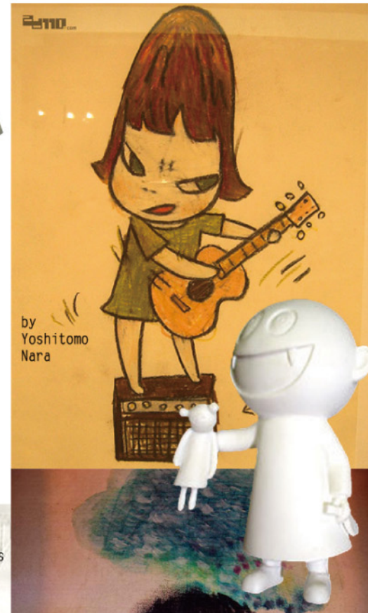
by Yoshitomo Nara