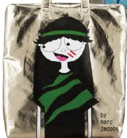
by marc jacobs