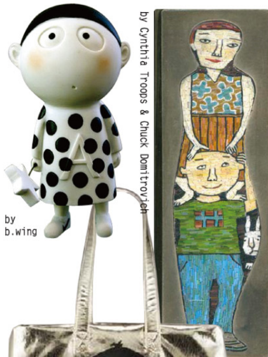
by Cynthia Troops & Chuck Domitrovich