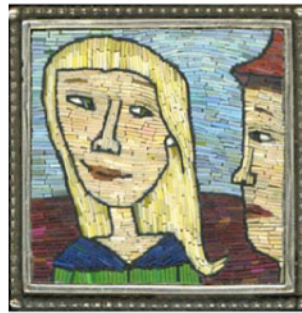
by Cynthia Troops & Chuck Domitrovich

讓我們一起咀嚼著你的我的他的生活中的人物，一起分享著你的我的他的故事，而這何嘗不也是當個一日名人的機會呢？